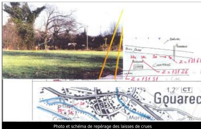
Photo et schéma de repérage des laisses de crues