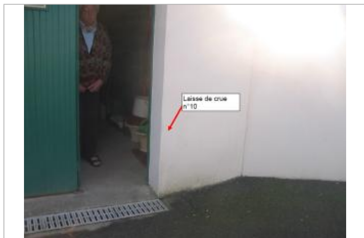
Garage lors du relevé des laisses de crues en 2003

Altitude calculée de l'eau (en m) : 131.99 m