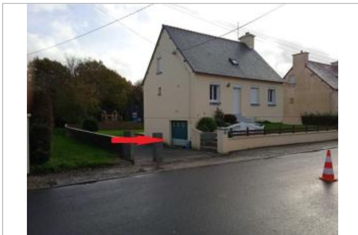
Maison et garage en 2023