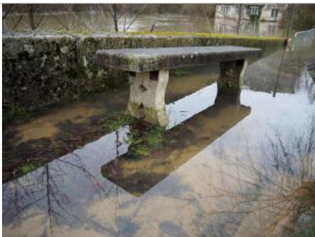
Trace matières fines

Altitude calculée de l'eau (en m) : 41.337