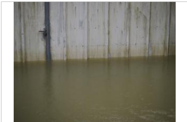
Trace matières fines

Altitude calculée de l'eau (en m) : 33.397 m