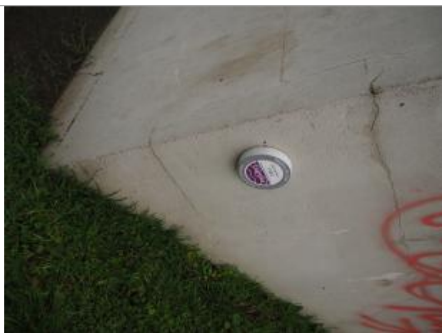
Trace matières fines

Altitude calculée de l'eau (en m) : 31.798 m