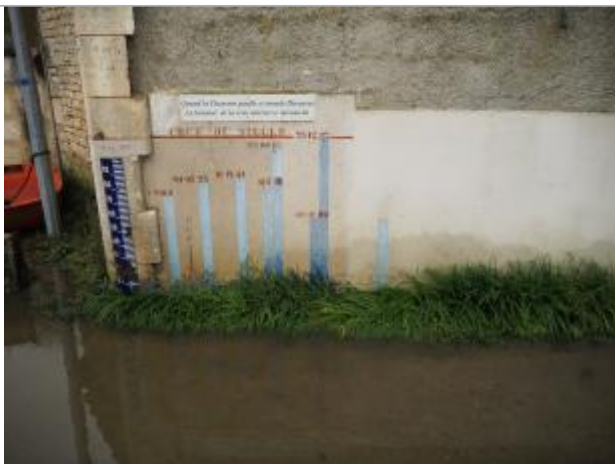
Trace matières fines

Altitude calculée de l'eau (en m) : 29.625 m