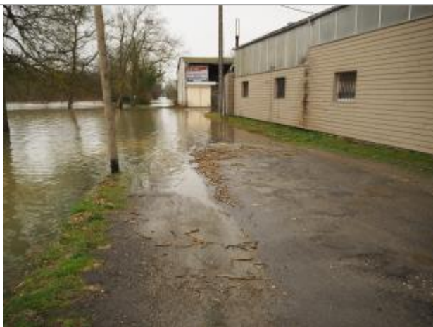
Trace amas végétaux

Altitude calculée de l'eau (en m) : 19.215 m