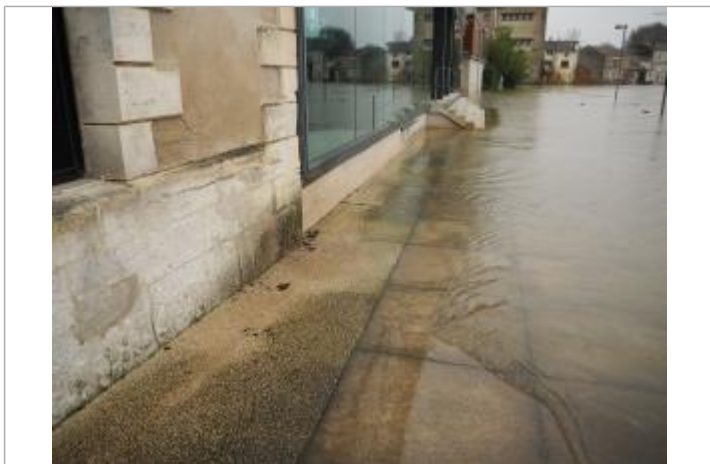
Niveau eau au pic

Méthode : Non renseigné Référence nivelée : Marque d'inondation Système altimétrique : NGF IGN 1969 (système normal) Altitude de la référence (en m) : 12.496 m Altitude calculée de l'eau (en m) : 12.496 m