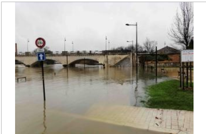
Trace amas végétaux

Méthode : Non renseigné Référence nivelée : Marque d'inondation Système altimétrique : NGF IGN 1969 (système normal) Altitude de la référence (en m) : 8.067 m Altitude calculée de l'eau (en m) : 8.067