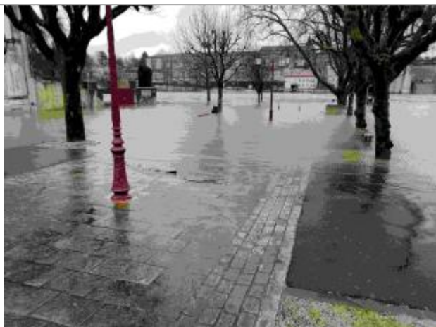
Trace amas végétaux

Altitude calculée de l'eau (en m) : 8.014