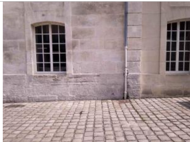
Photo du site

Coordonnées RGF93 (ETRS89) : X: -0.3320069 / Y: 45.6967154