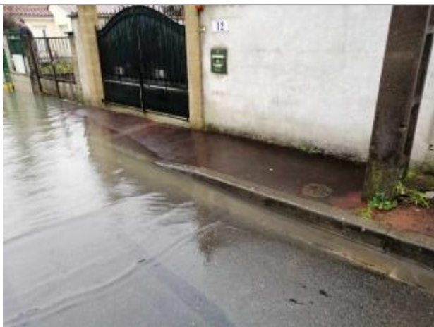
Niveau eau au pic

Altitude calculée de l'eau (en m) : 7.646 m