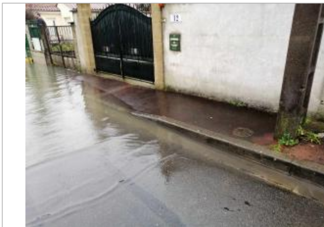
Niveau eau au pic

Altitude calculée de l'eau (en m) : 7.646 m