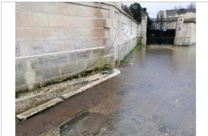
Niveau eau au pic

Altitude calculée de l'eau (en m) : 7.526 m