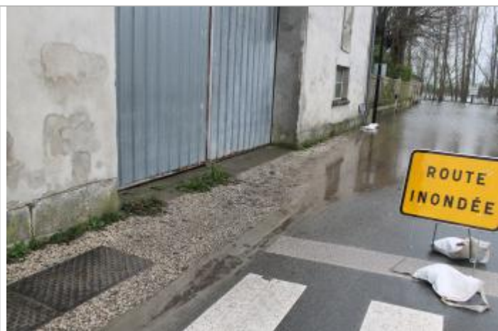
Trace amas végétaux

Altitude calculée de l'eau (en m) : 7.091 m