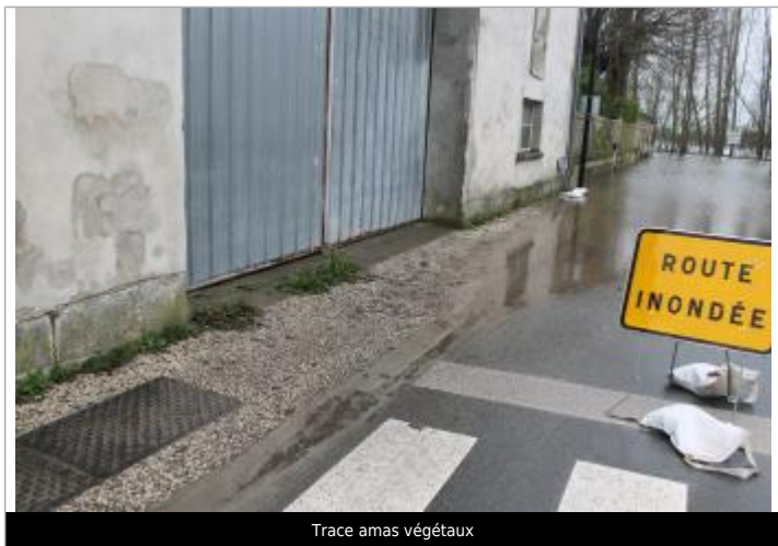
Trace amas végétaux

NIVELLEMENT D'ORIGINE Méthode : Non renseigné Référence nivelée : Marque d'inondation Système altimétrique : NGF IGN 1969 (système normal) Altitude de la référence (en m) : 7.091 m Altitude calculée de l'eau (en m) : 7.091