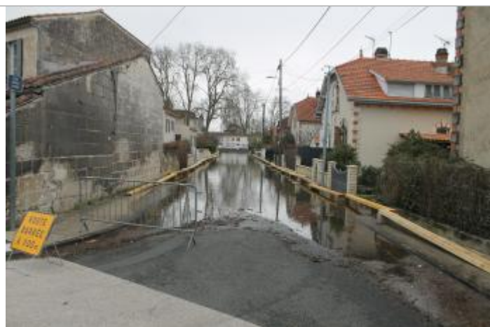
Trace amas végétaux

Altitude calculée de l'eau (en m) : 6.364 m