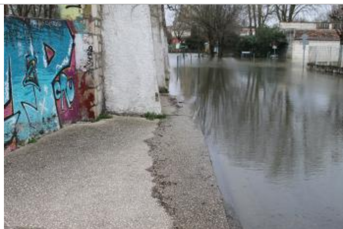
Trace matières fines

Altitude calculée de l'eau (en m) : 6.41 m