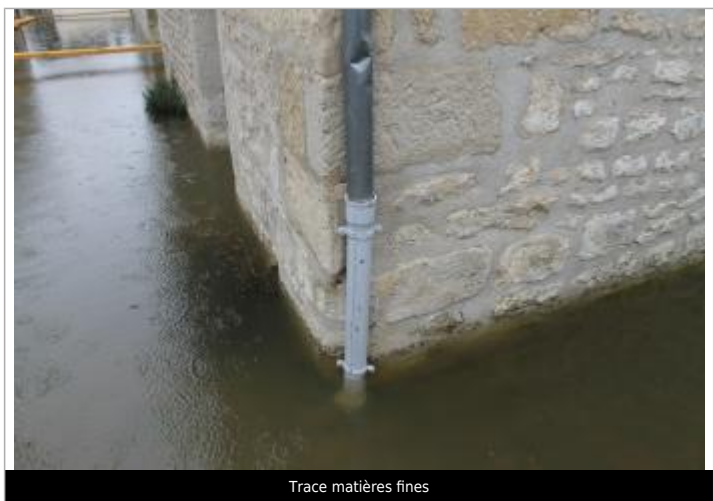
Trace matières fines