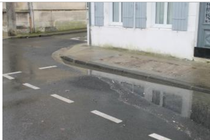
Niveau eau au pic