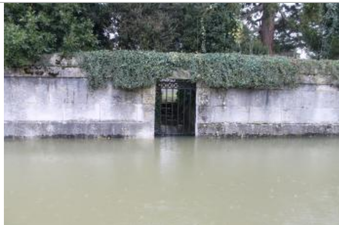
Niveau eau au pic