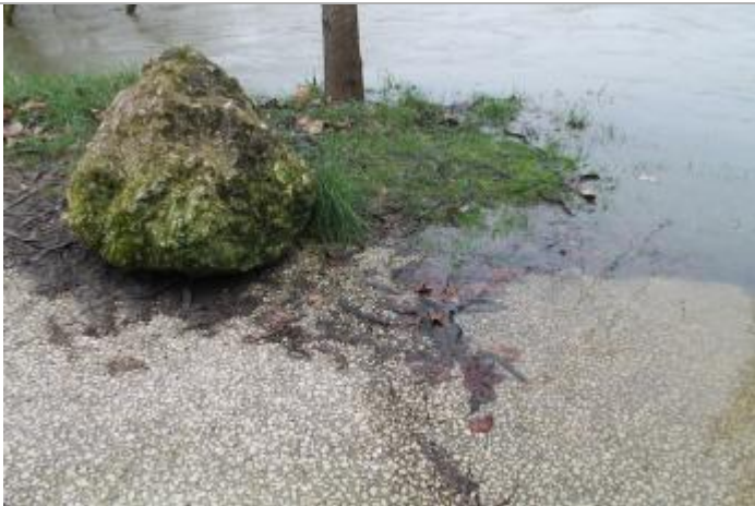
Niveau eau au pic