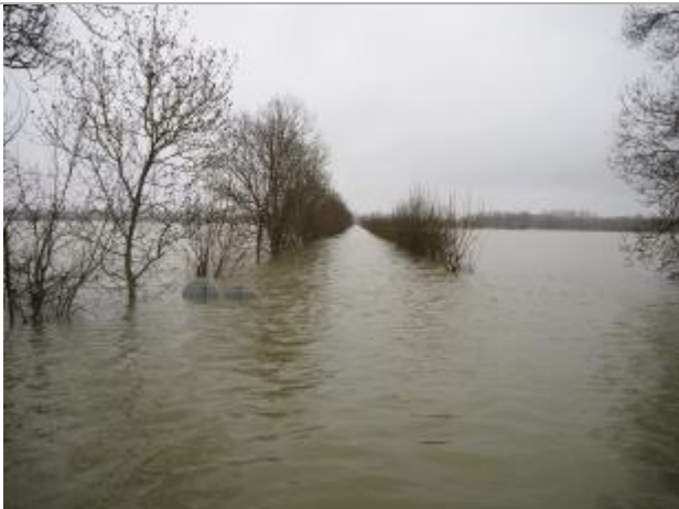
Niveau eau au pic