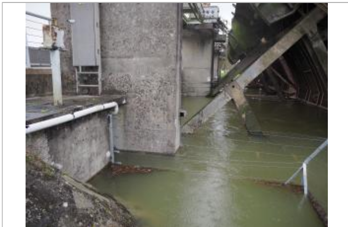
Niveau eau au pic