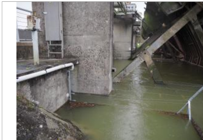
Niveau eau au pic