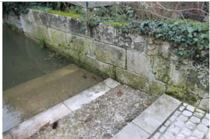
Trace matières fines