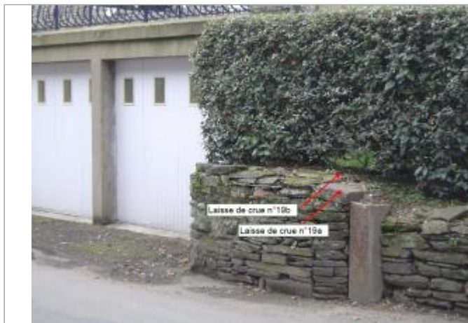
muret à coté des garages rue de la gare