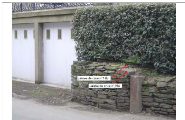
Muret près des garages

Altitude calculée de l'eau (en m) : 131.3 m