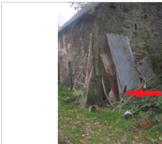
Bâtiment limite de la laisse de crue en 2019

Coordonnées WGS84 : X: -3.18156467 / Y: 48.24005550