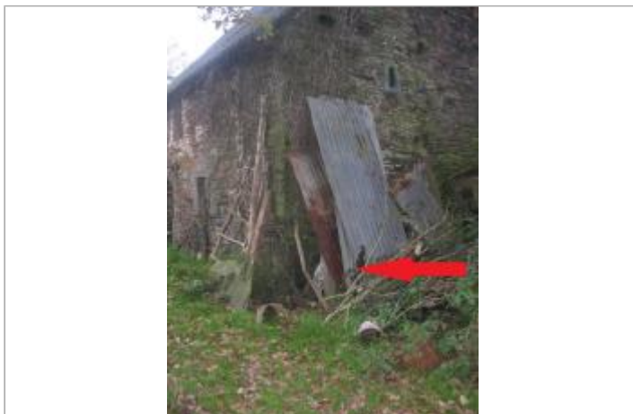
Bâtiment limite de la laisse de crue en 2019