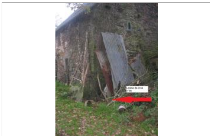
Bâtiment limite de la crue de 1974 photographié en 2019

Altitude calculée de l'eau (en m) : 132.46 m