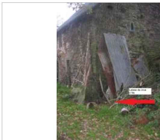
Bâtiment limite de la crue de 1974 photographié en 2019