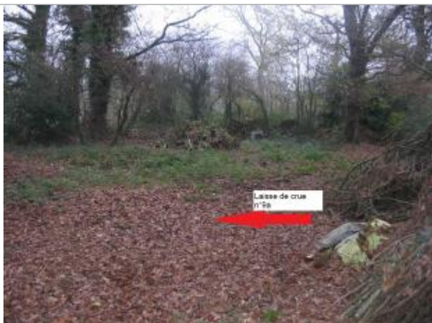
Terrain naturel 10m en aval du bâtiment

Altitude calculée de l'eau (en m) : 132.04