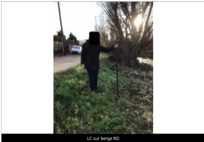
LC sur berge RD

Altitude calculée de l'eau (en m) : 4.342 m