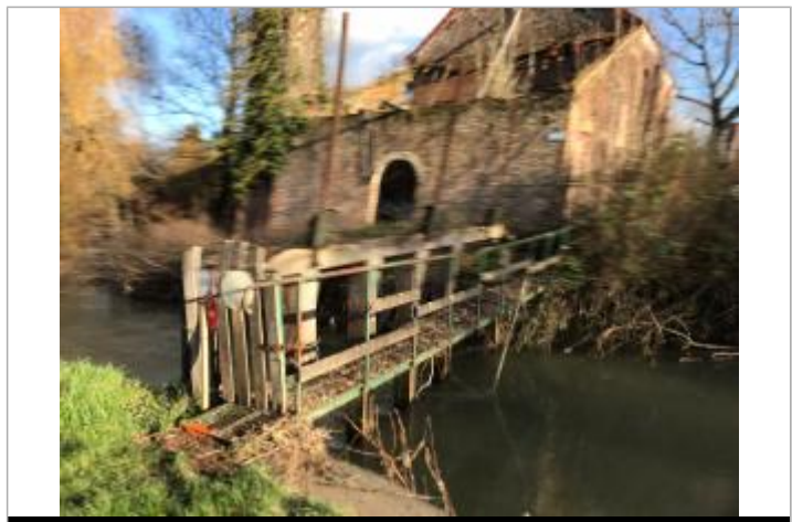
nivellement à la marque orange bord passerelle

GÉNÉRAL Code : WEB_R_202303105043 Date de mise à jour : 11/06/2024 Auteur : SPC BN