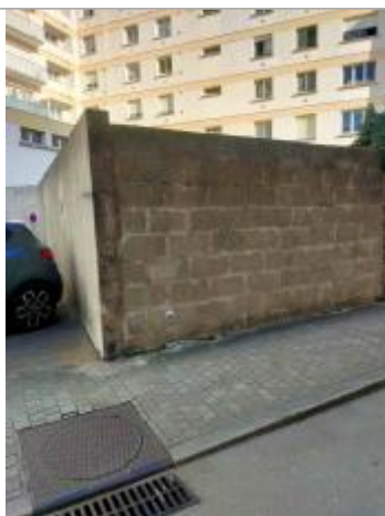
Rue de la Coutume - Vannes

Altitude calculée de l'eau (en m) : 5.82 m