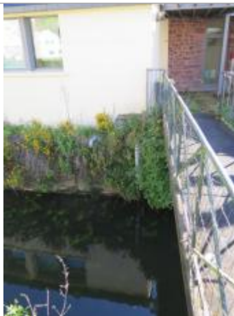
Echelle limnimétrique du Garun au centre ville de Montfort sur Meu