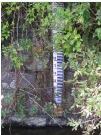
Echelle limnimétrique du Garun au centre-ville de Montfort-sur-Meu en 2018