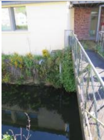
Echelle limnimétrique du Garun au centre ville de Montfort sur Meu