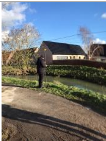
sur le haut de la berge

Altitude calculée de l'eau (en m) : 4.693 m