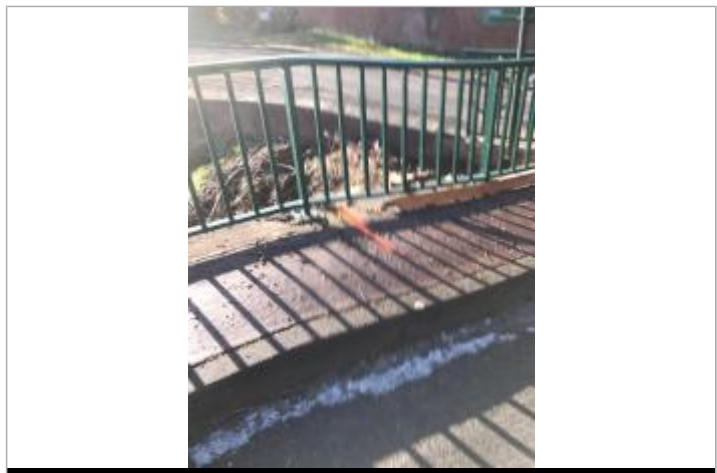
LC sur le pont

GÉNÉRAL Code : WEB_R_202303062846 Date de mise à jour : 06/03/2023 Auteur : SPC BN