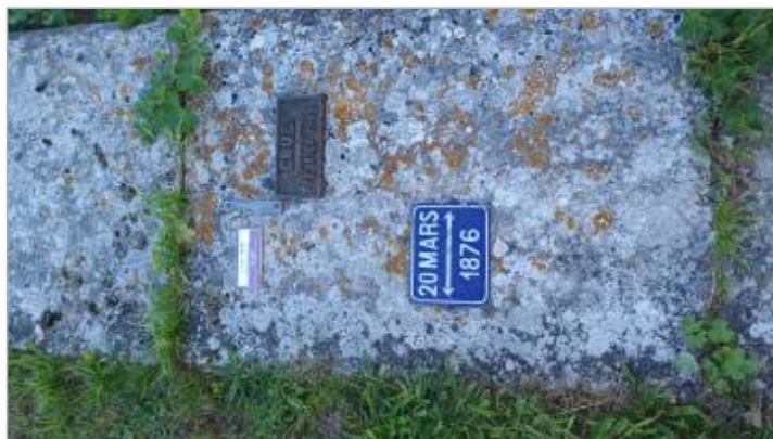
Nouvelle plaque 1910 (posée en 2025)

SOURCE DE REPÉRAGE : VISITE DE TERRAIN SPC SACN - 11/03/2020