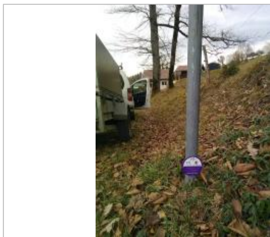
Crue du Fernex du 17 juin 2008

Type de repérage : Source bibliographique