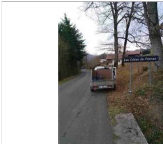
panneau "les côtes du Fernex"