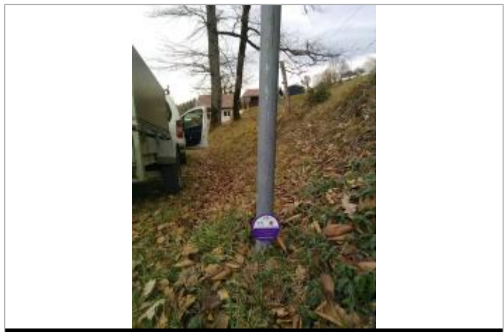
Crue du Fernex du 17 juin 2008

MARQUE Maximum de l'inondation : Oui Visibilité : Oui État du repère : Bon Pérennité : Longue Repère calculé : Non PHEC : Oui