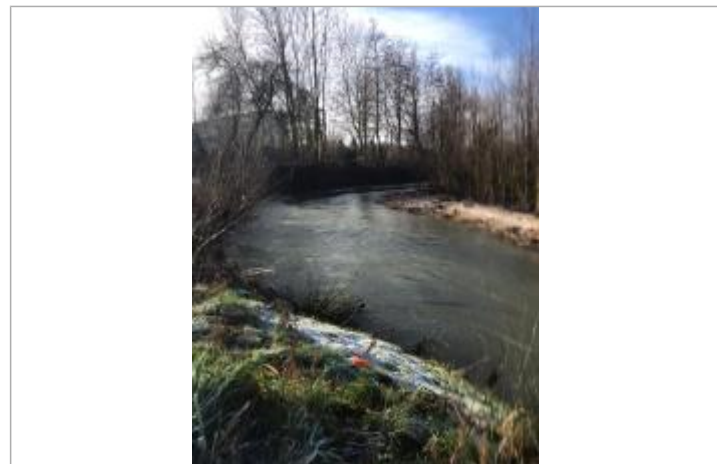
Limite LC au point orange sur l'herbe