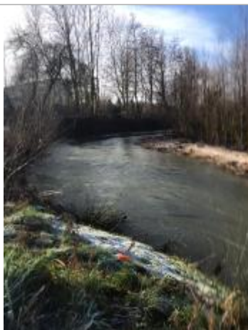
Limite LC au point orange sur l'herbe

Altitude calculée de l'eau (en m) : 23.1079