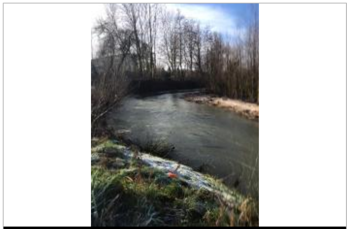
Limite LC au point orange sur l'herbe

GÉNÉRAL Code : WEB_R_202302231649 Date de mise à jour : 27/02/2023 Auteur : SPC BN