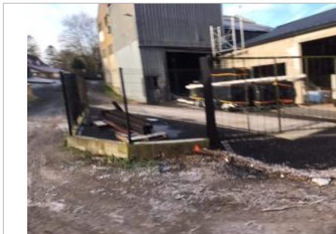
laisse de crue départ au marquage orange

SOURCE DE REPÉRAGE : CAMPAGNE DE RELEVÉS DE LAISSES DE CRUES - 19/01/2023