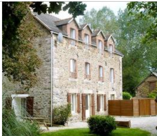
Moulin de la cornillère à Lamballe