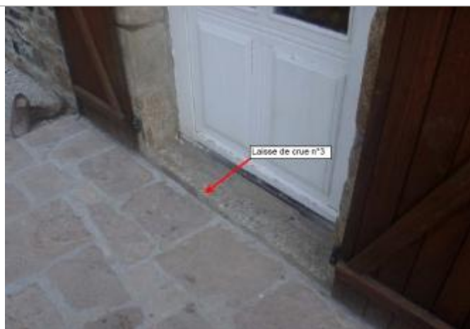
seuil de la porte d'entrée du moulin

Organisme(s) : SPC Vilaine - Côtiers bretons