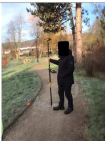
LC dans le parc public

Altitude calculée de l'eau (en m) : 28.59 m