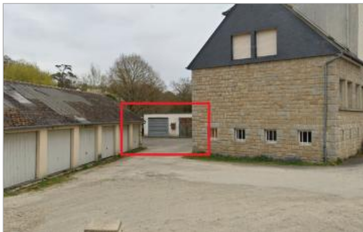
Ancien hangar des services techniques