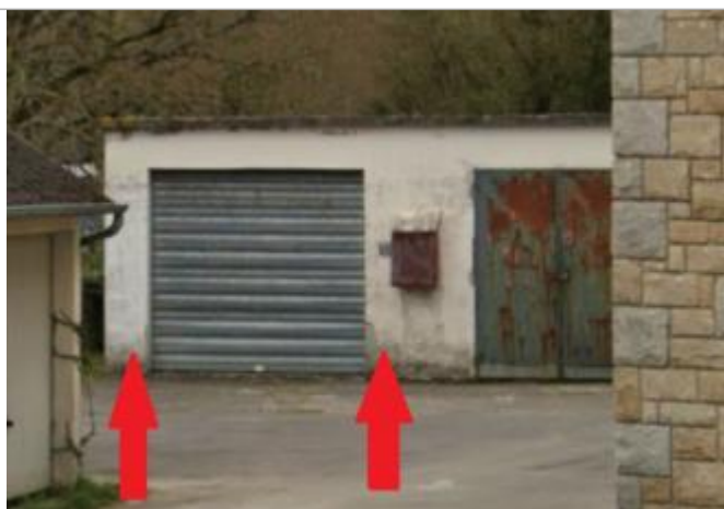
Ancien hangar des services techniques

Altitude calculée de l'eau (en m) : 24.66 m