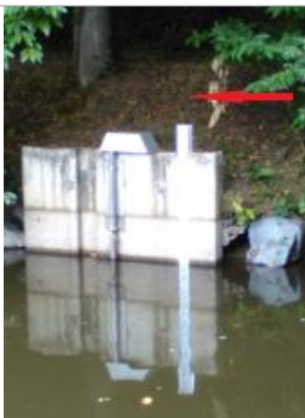
Echelle limnimétrique de la station de l'Arguenon entrée retenue

Altitude calculée de l'eau (en m) : 23.965