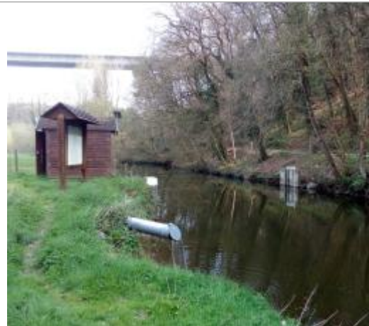
site de la station hydrométrique de l'Arguenon entrée de retenue