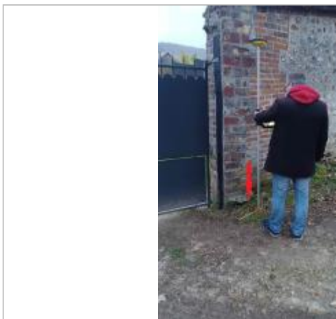
Laisse de crue au à 30 cm de l'angle du mur