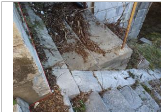
Débris végétaux sur les marches du pont