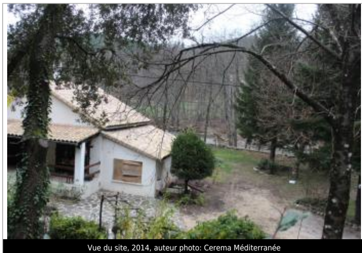
Vue du site, 2014