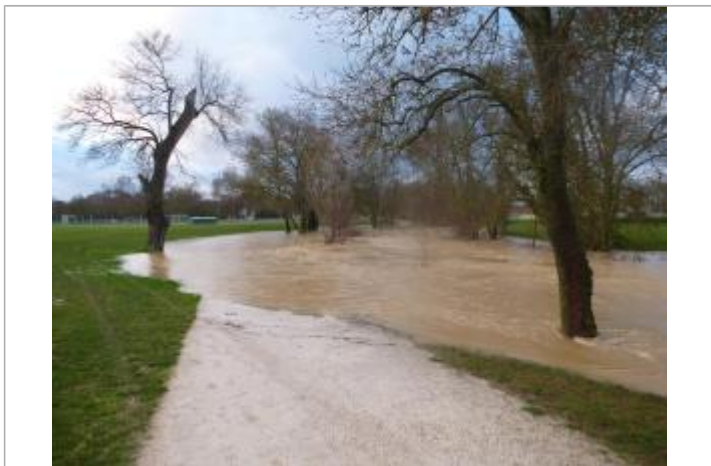
Le Touch déborde sur le chemin piétonnier