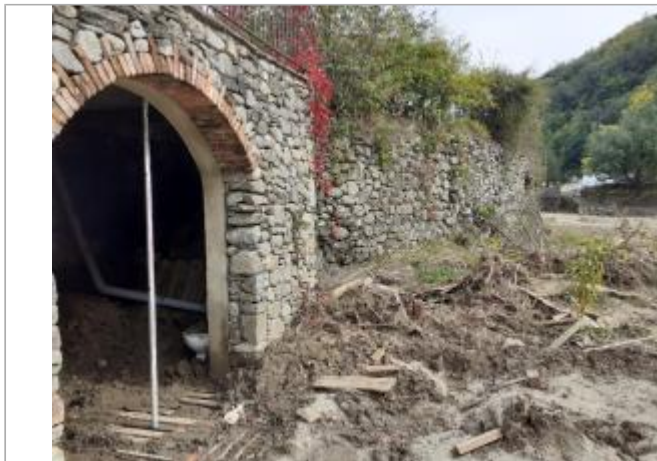
Vue du site, photo OTEIS